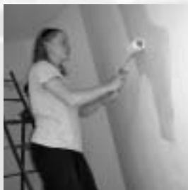
Die Altarwand wird gestrichen