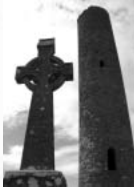
Hochkreuz auf Holy Island