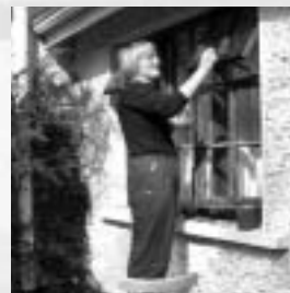
... und die Fenster