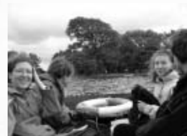
Auf einem Ausflug