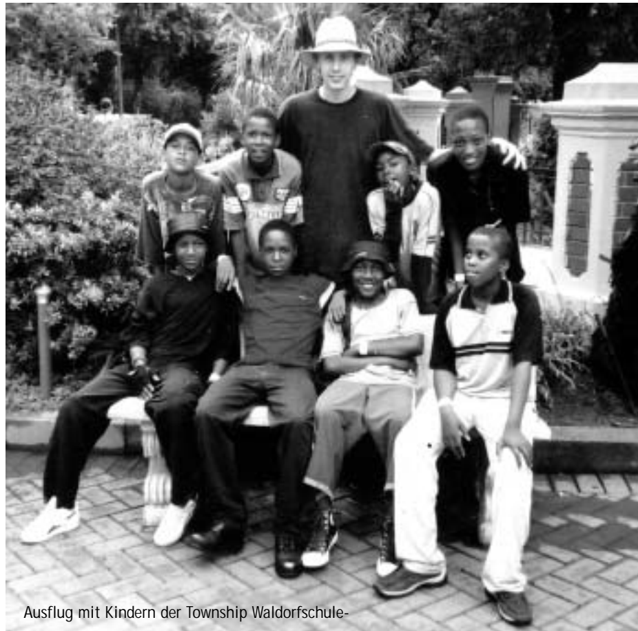
Ausflug mit Kindern der Township Waldorfschule-