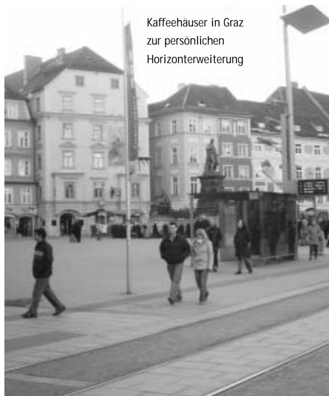
Kaffeehäuser in Graz zur persönlichen Horizontenerweiterung