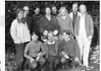
Die Teilnehmer des öffentlichen Samstagskurses